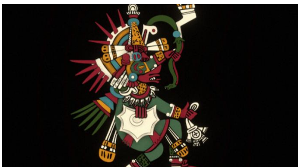
Le dieu Quetzalcoatl 1