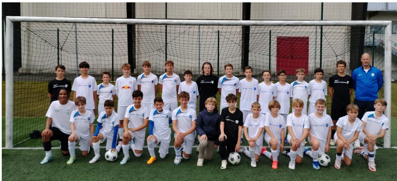
Section Foot Ste Anne 2024-2025

Pour couvrir les frais engendrés par cette activité, nous vous demandons une contribution fixée à 70 € pour l'année scolaire 2025/2026. Cette somme sera imputée sur la facture annuelle.